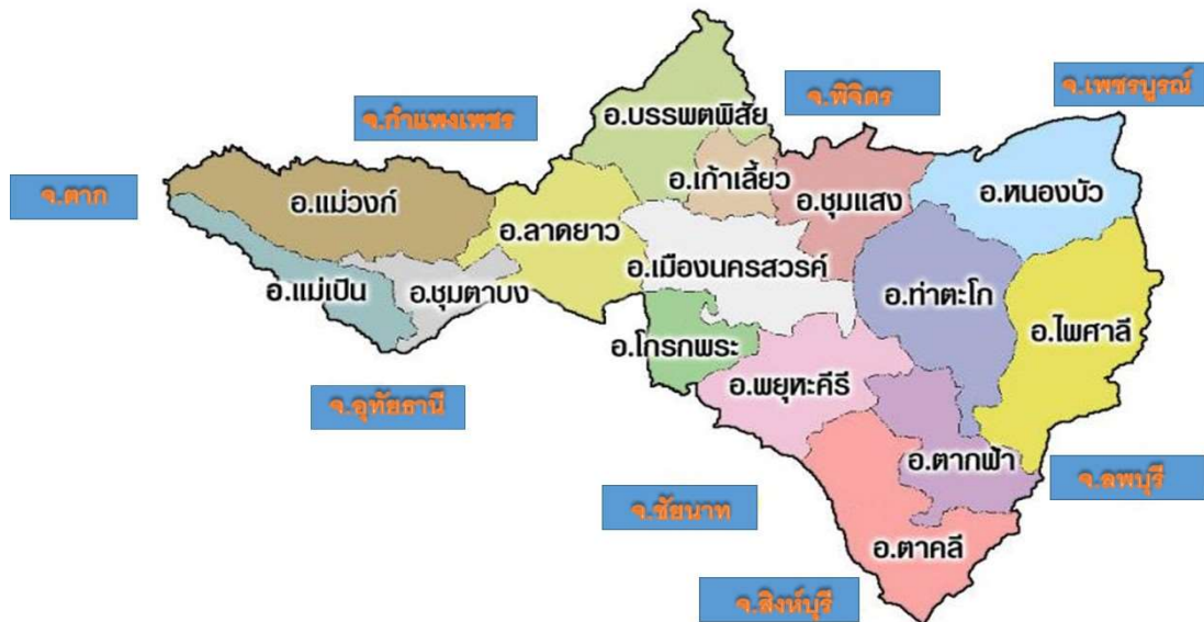
แผนที่จังหวัดนครสวรรค์

ทิศตะวันตก ติดต่อกับ อำเภอเมืองอุทัยธานี อำเภอทัพทัน อำเภอสว่างอารมณ์ อำเภอลานสัก อำเภอบ้านไร่ จังหวัดอุทัยธานี อำเภออุ้มผาง จังหวัดตาก