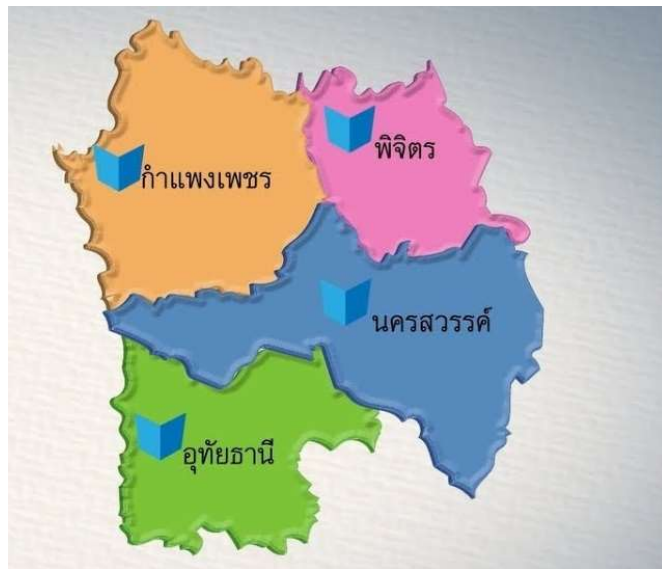
ภาพที่ 2 แผนที่จังหวัดในพื้นที่ของสำนักงานศึกษาธิการภาค 18

โดยสำนักงานศึกษาธิการจังหวัดนครสวรรค์ อยู่ในสังกัดสำนักงานปลัดกระทรวงศึกษาธิการ และอยู่ในพื้นที่ของสำนักงานศึกษาธิการภาค 18 ซึ่งประกอบด้วยจังหวัดทั้งหมด 4 จังหวัด คือจังหวัดนครสวรรค์ จังหวัดอุทัยธานี จังหวัดกำแพงเพชร และจังหวัดพิจิตร