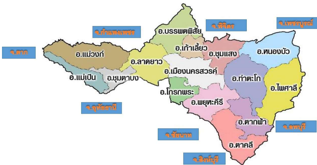
แผนที่จังหวัดนครสวรรค์

ทิศตะวันตก ติดต่อกับ อำเภอเมืองอุทัยธานี อำเภอทัพทัน อำเภอสว่างอารมณ์ อำเภอลานสัก อำเภอบ้านไร่ จังหวัดอุทัยธานี อำเภออุ้มผาง จังหวัดตาก